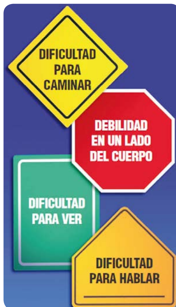
Figura 1. Síntomas de alarma de trombosis cerebral.

Hasta el 2009 se recomendaba no usar el tratamiento después de las tres horas de haber iniciado los síntomas, lo que dejaba por fuera a muchos pacientes que llegaban después de esta hora límite; sin embargo, nuevos estudios